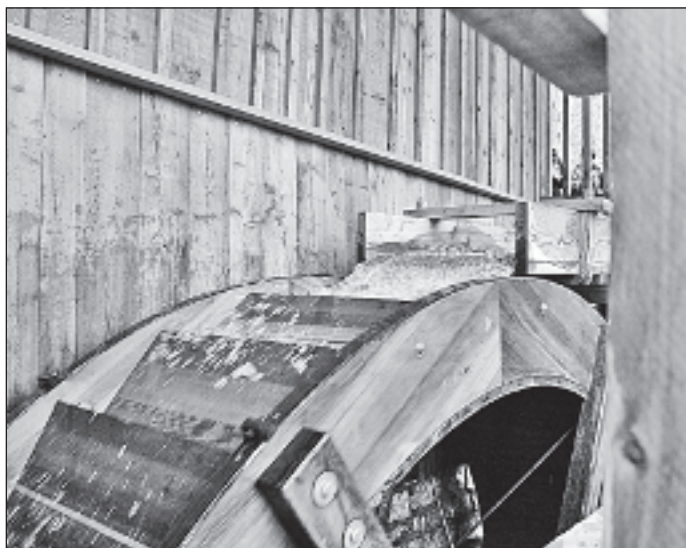
Die Kraftübertragung vom Wasserrad lässt die Säge arbeiten.