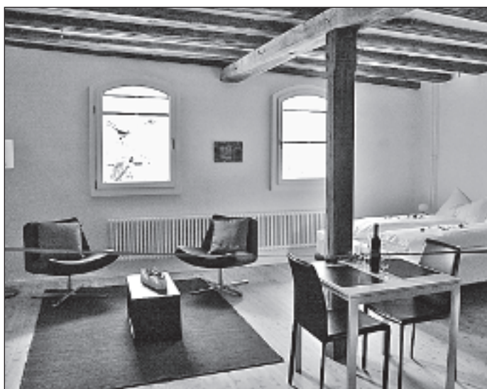
Ein neues Angebot in gemütlicher Atmosphäre: Bed and Breakfast in Turtmann.