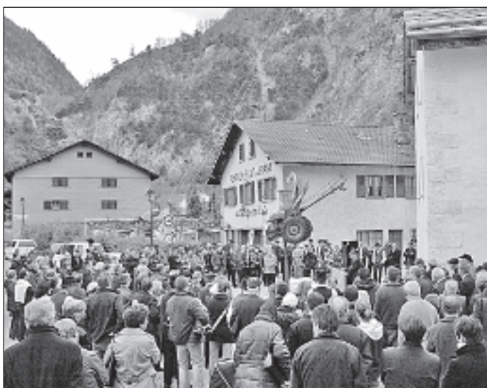
Die Turtmänner verfolgten gespannt die geschichtlichen Ausführungen der Redner.