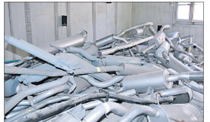
Auspuffe im Multipack. Eine Klanginstallation im Anfangsstadium.