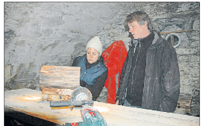
Klingende Schatztruhen wird man im Schlossruinenkeller finden.