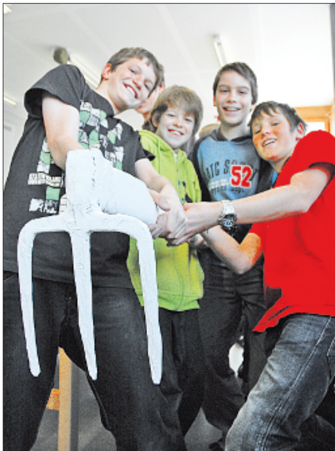
Auch die Turtmänner Jugend hilft mit, sie klebte Objekte aller Art ein.