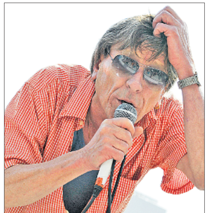
Polo Hofer: «Laut Duden ist ein Prototyp ein erstes betriebsfähiges Modell – und das bin ich.»

Konzert: Freitag, 26. März, Simplonhalle Brig