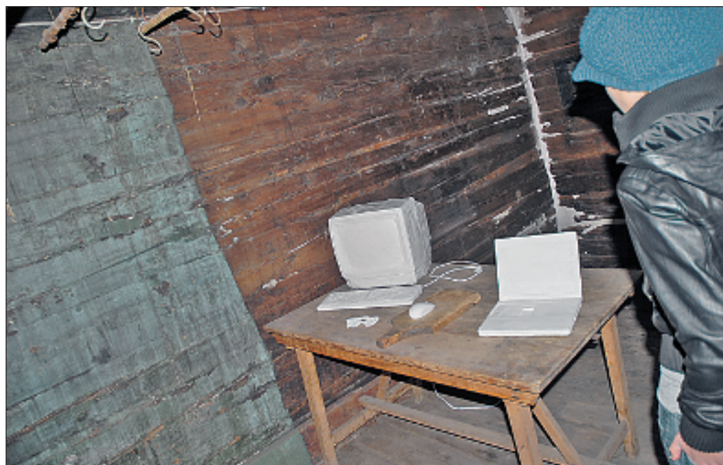
Alltagsdinge aus unseren heutigen Zeiten – ganz in Weiss und nicht mehr zu gebrauchen.