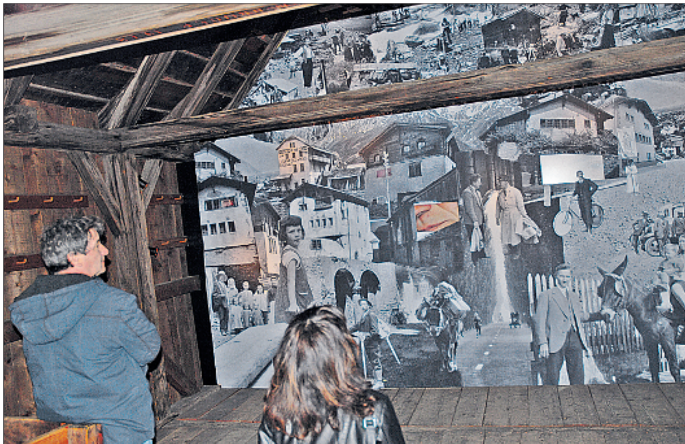
Was typisch ist für Turtmann, ist in der Schützenlaube zu erfahren.

Es gibt viel zu sehen und zu hören in den alten Räumen. Beeindruckend dabei ist nicht nur die mechanisch animierte Fototape in der Schützenlaube, welche Turtmännerinnen und Turtmänner von heute zu Worte kommen lässt. Auch das «Netzwerk