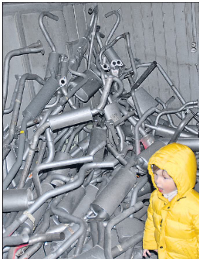
Blick ins Kaplaneihaus: Auspuff um Auspuff – fast bis zur Decke.

sante «Auspuff-Sammlung» im Kaplaneihaus hin. Und all die eingepigsten Alltagsgegenstände heutiger Zeiten verleihen den Räumlichkeiten des Gasnerhauses eine Atmosphäre, die als gespannt und gleichzeitig anregend-verspielt sich bezeichnen lässt.